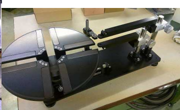
ワーク厚さ測定機