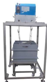
簡易バレル洗浄機