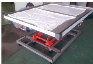
昇降排水溝付作業台